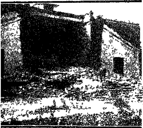
मुजफ्फरपुर के मि० ई० जूडा का निवासगृह